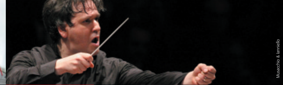
Musacchio & Ianniello